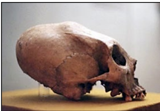
Figura 2. Deformación oblicua del cráneo causada por compresión de la parte posterior de la calota (América Central).

Otro ejemplo es la práctica de vendar apretadamente los pies de niñas chinas, en familias de alto rango. Esta práctica estuvo vigente durante al menos 20 siglos. El proceso de vendaje empezaba cuando las niñas tenían entre 4 y 6 años, y era realizado por la madre. Los pies eran puestos a remojar en agua con algunas hierbas, para eliminar todos los restos de piel muerta, y las uñas se cortaban tanto como era posible. Después de un masaje, los 4 dedos más pequeños se rompían. Luego, los pies se vendaban con seda o algodón empapado en líquido, apretando los dedos contra el talón. Cada dos días se retiraba el vendaje y se volvía a realizar, pero las vendas cada vez se ponían más apretadas. El proceso duraba dos años. Para entonces, los pies medían solo unos 10 cm. Se puede uno imaginar lo doloroso de todo esto. Durante los siguientes 10 años, los pies también seguían vendados, aunque la frecuencia con que se apretaban era menor.