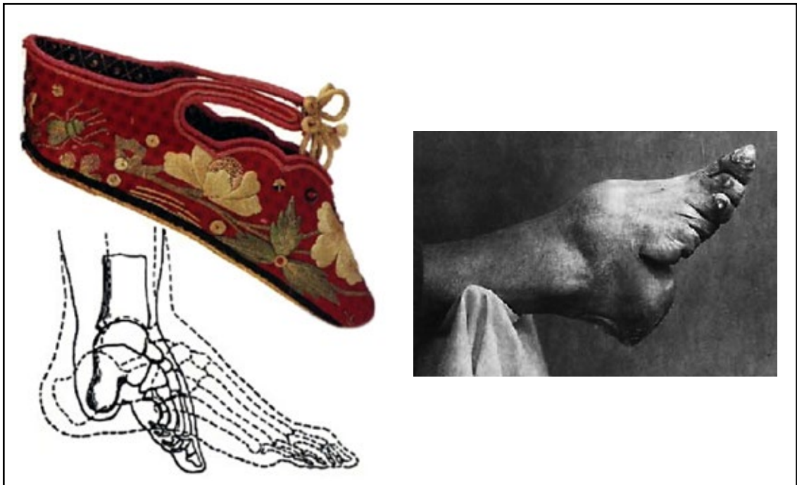
Figura 3. Deformación pedal por vendaje compresivo (China), foto y dibujo. También se observa un zapato para un pie deformado.

(Recibido: abril de 2013. Aceptado: mayo de 2013)