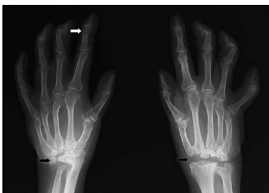
Figura 3. Radiografía de las manos. Se observa imagen de osteólisis de los huesos de ambos carpos (flechas negras) y osteólisis de zonas interfalángicas distales (flecha blanca), en un varón con Osteólisis Idiopática Multicéntrica.

Se verifica en las radiografías osteólisis en carpos y tarsos y lesiones líticas en regiones interfalángicas (Figuras 3 y 4).