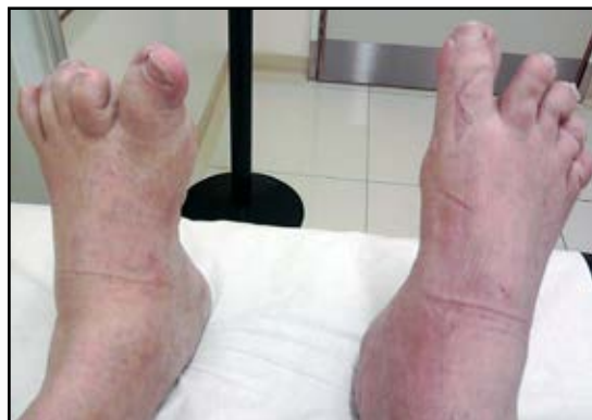
Figura 2. Compromiso de los pies en un varón con Osteólisis Idiopática Multicéntrica. Se muestra alteración de la alineación de los dedos: obsérvese el cuarto y quinto dedo del pie derecho (telescopado).

El paciente se encuentra en plan de rehabilitación ortopédica, y está tratado con suplemento de calcio (1 g/día).