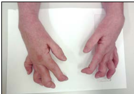
Figura 1. Compromiso de las manos en un varón con Osteólisis Idiopática Multicéntrica. Se observa actitud en flexión de ambos carpos; en los dedos, tendencia a la extensión de las interfalángicas proximales y flexión de las distales; algunos dedos telescopados.

periores. Dice "yo escribo desde el hombro". Camina con leve dificultad, similar semiología en ambos pies (Figuras 1 y 2). Tensión arterial 120/80. El peso es normal 72 kg y la talla es de 1,75 m.