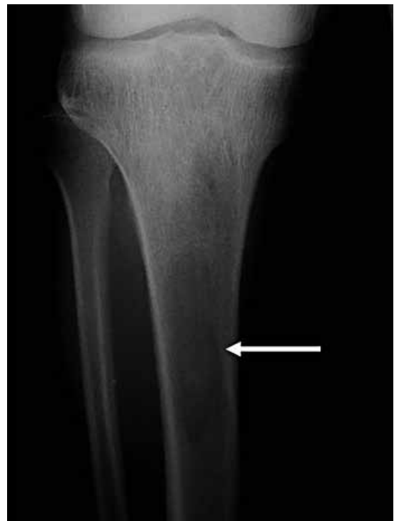
Figura 1. Radiografía frente tercio proximal de la tibia. Nótese la imagen radiolúcida en forma de "V" en el extremo distal (flecha).

Paciente de sexo masculino de 66 años, quien consulta por dolor óseo en pierna derecha. La radiografía muestra una zona radiolúcida con forma de "V" en tibia proximal (Figura 1). Se solicitó resonancia magnética (RM) por el intenso dolor del paciente y tomografía computarizada (TC) para evaluar la estructura ósea. La RM muestra una fractura de estrés como una zona de edema óseo, hiperintensa en secuencia STIR, asociada a una imagen lineal horizontal en el tercio proximal de la tibia (Figura 2), mientras que la TC presenta una imagen lítica en la tibia asociada a engrosamiento de trabéculas, por lo cual se presume la enfermedad ósea de Paget (Figura 3). Además se realiza biopsia percutánea que confirma este diagnóstico. En la TC no se observa la fractura por estrés.