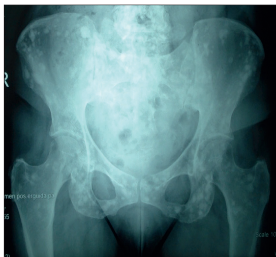
Figura 1. Comparación de Rx de pelvis entre 2009 y 2012. Se advierte incremento de lesiones osteocondensantes.