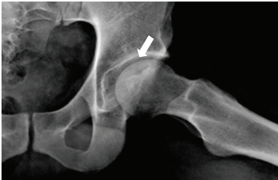
Figura 1. Radiografía de cadera. Signo de la semiluna. Existe una línea de menor densidad radiológica en la región subcondral, sin deformidad de la superficie articular. Grado II.