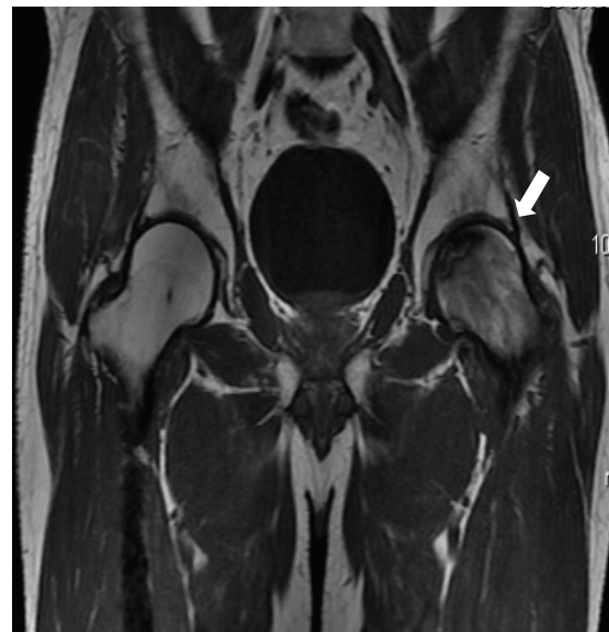
Figura 3. Resonancia magnética, secuencia ponderada en T1, plano coronal. Se identifica en topografía de cabeza femoral izquierda signo de la doble línea. Grado II.